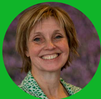
Deanne Radema Onderwijscommissie