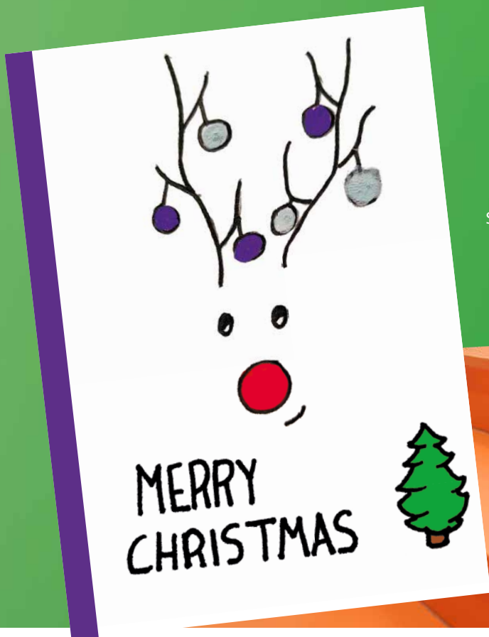
Shalom met haar winnende ontwerp